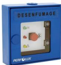
Bouton de commande